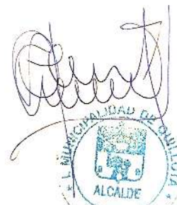
Firmado Digitalmente por OSCAR CALDERÓN SÁNCHEZ ALCALDE MUNICIPALIDAD DE QUILLOTA