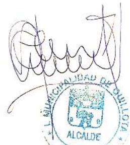
Firmado Digitalmente por OSCAR CALDERÓN SÁNCHEZ ALCALDE MUNICIPALIDAD DE QUILLOTA