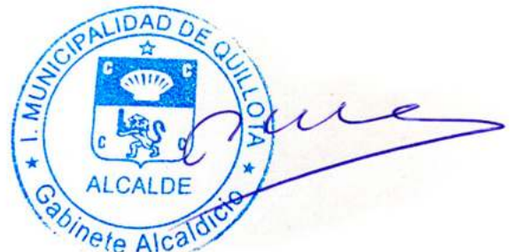
Firmado Digitalmente por LUIS MELLA GAJARDO ALCALDE MUNICIPALIDAD DE QUILLOTA