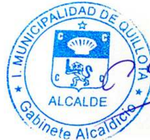
Firmado Digitalmente por LUIS MELLA GAJARDO ALCALDE MUNICIPALIDAD DE QUILLOTA