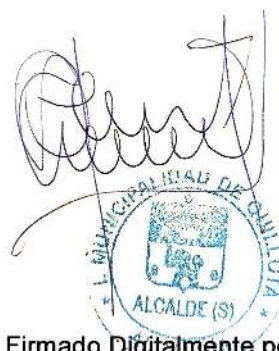
Firmado Digitalmente por OSCAR CALDER N S NCHEZ ALCALDE (S) MUNICIPALIDAD DE QUILLOTA