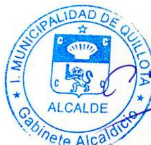
Firmado Digitalmente por LUIS MELLA GAJARDO ALCALDE MUNICIPALIDAD DE QUILLOTA